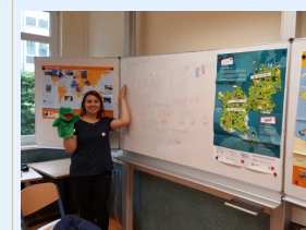
Das FranceMobil 2018 am HEG