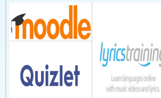
Einige moderne Medien, die du im Unterricht verwenden wirst

🤖 In diesem QR-Code gibt es Einiges, das wir nur für dich zusammengestellt haben!