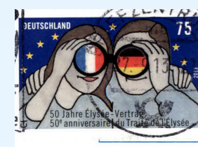
Wir feiern an der ganzen Schule im Januar die deutsch-französische Freundschaft!