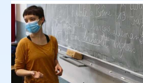
Das FranceMobil 2020 am HEG